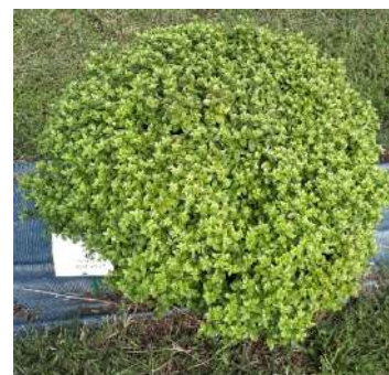
Pittosporum tenuifolium variegatum